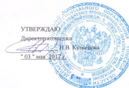
График государственной итоговой аттестации в 2017 г. (защита выпускных квалификационных работ) очное обучение